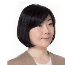
コピーライター・ クリエイティブディレクター

今回はリモート審査となりましたが、作り手の方々の思いが詰まった福島のいいものをたくさん感じることができました。今年は世の中の価値観が、昔からあるものや身近にあるものへのありがたみが増したり、逆に新しいものを柔軟に取り入れる人が増えたりと、二極化が進んだように思います。私も自粛生活の中で、便利なものや家で食べられる美味しいもの、楽しめるものに目が向くようになり、そんなニーズに寄り添う福島の品がたくさんあることを知り、本当に嬉しく思います。