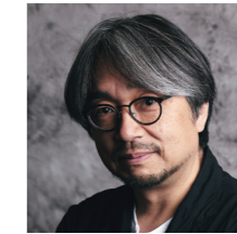
放送作家・脚本家・ 京都芸術大学副学長