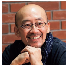
株式会社日本百貨店 取締役

福島県では、県産品のパッケージデザイン等の向上による商品力強化を目的に、優れたデザインの県産品を表彰する「ふくしまベストデザインコンペティション」を開催しました。 応募総数 217 商品から選ばれた受賞商品をご紹介します。